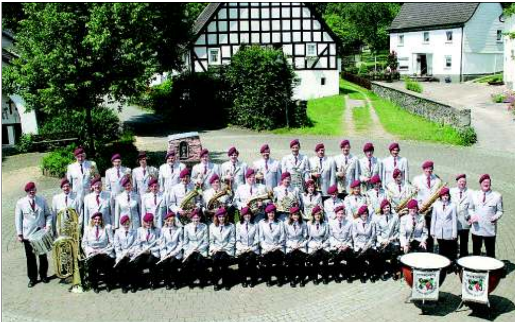
Der MV Dünschede setzt dem Fest seit Jahren die musikalischen Sahnehäubchen auf.