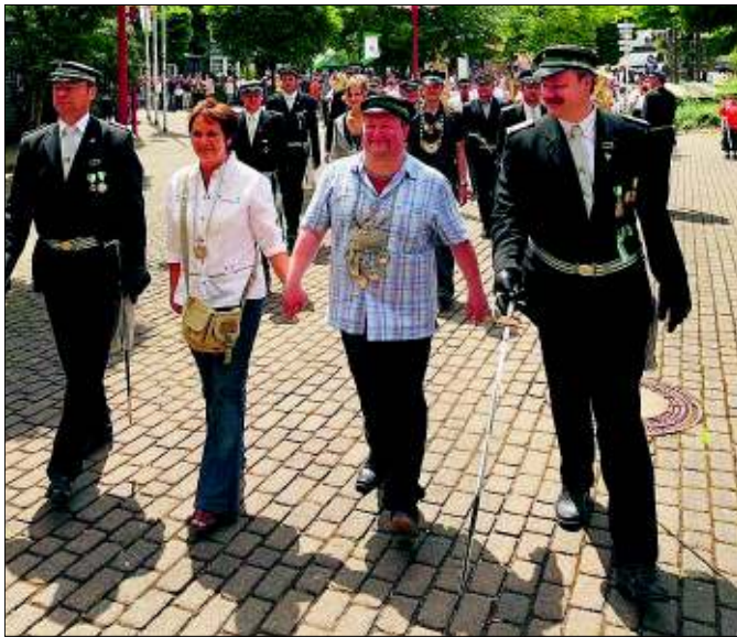
Königspaare, Kaiserwetter & klimpernde Ketten.