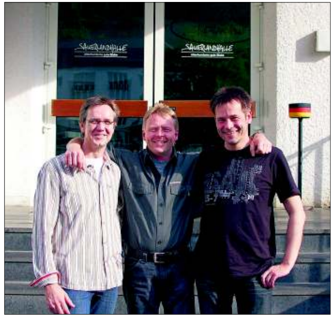
Lumineszenz Mäzene unter sich.

Altenhundem. Nachdem die Jammertaler Gemeinschaften Osterfeuerverein, Nikolausverein und Alte Herren bereits im April mit einer Spende von 1.111 Euro für die Umrüstung der Beleuchtung in der Volksbankarena Sauerlandhalle auf Energiesparlampen unterstützt haben, erhöhen unsere drei Altenhundemer Elektroinstallationsfirmen, Bergmoser, Köster und Wittmund den Betrag und sorgen für die Realisierung der Umrüstung unserer Halle auf energiesparende Beleuchtung. Diese Investition kommt damit sowohl dem Schützenverein als auch den Mietern der Halle zugute. Der Vorstand des Schützenvereins bedankt sich herzlich und hofft damit auch andere Bürger, Schützenbrüder und Unternehmen zu motivieren, sich an den verschiedenen Unterstützungsmöglichkeiten wie zehn Jahre Beitrags-