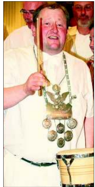
Lied Aus!

Auch 2008 fand wieder der Seniorennachmittag des Schützenvereins statt. Die Veranstaltung ist mittlerweile nicht mehr wegzudenken und erfreut sich einer immer größeren Teilnehmerzahl. So konnten im vergangenen Jahr über 180 Senioren einen abwechslungsreichen und stimmungsvollen Nachmittag in der Volksbankarena erleben. Die Schützenbrüder erlebten mit ihren Frauen ein gelungenes Rahmenprogramm mit musikalischen Darbietungen, Rückblicken auf vergangene Schützenfeste und einem reichhaltigen Buffet.