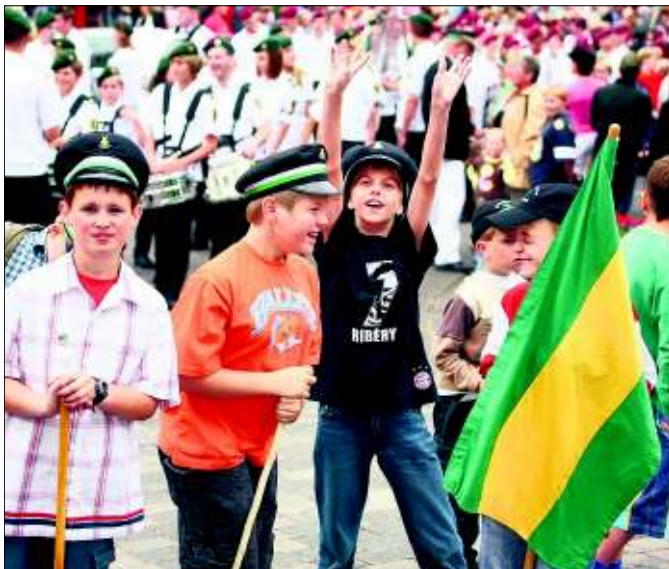
Das Offizierskorps im Jahre 2029.

Vierte Corporalschaft „Jammertal“: Treffpunkt ist jeweils die Gaststätte Forelle im Jammertal. Aufgrund des langen Marschweges trifft sich die 4. Corporalschaft eine Viertelstunde früher als die anderen drei: Sonntag: Treffen ab 14.15 Uhr; Abmarsch um 14.45 Uhr; Montag: Treffen ab 15.45 Uhr; Abmarsch um 16.15 Uhr