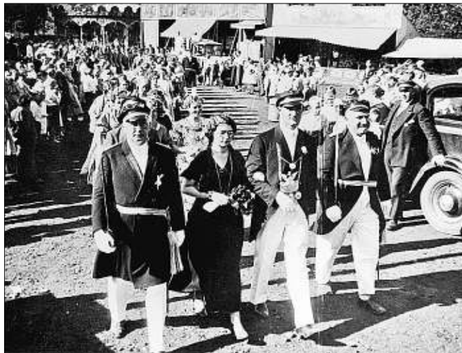
Schützenfest im Jahre 1934.