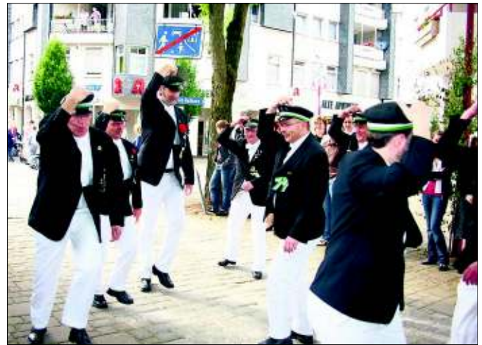
Was hier so unbeschwert aussieht, ist das Ergebnis einer komplizierten Schrittfolge.