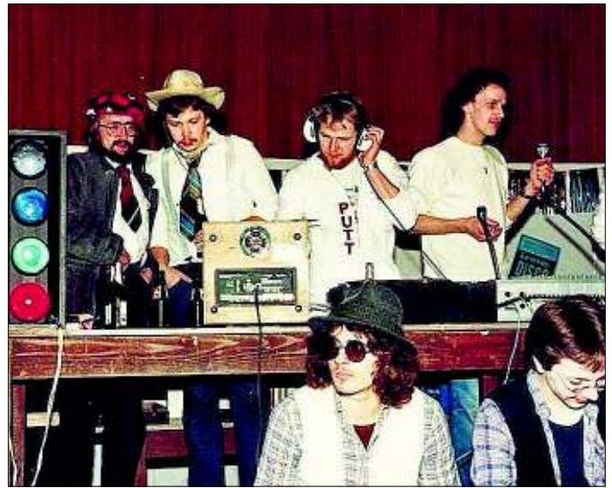
Älter gewordene Jungschützen zeigt dieses alte Bild mit damals jungen Schützen.

Geschichtsbücher des Vereins als Jungschützenkönig verewigte. Dieses Schießen wurde noch im Toilettengang der Schützenhalle ausgetragen - und das nicht etwa auf einen Vogel, sondern auf Plättchen (bekannt aus den Schießbuden). Gleichmaßen war das Jahr 1974 das Geburtsjahr der bis heute sehr erfolgreichen