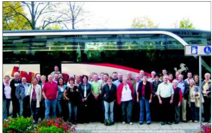
Die letzte Aufnahme des Offizierkorps (mit Frauen) bevor in München die Biervorräte knapp wurden.

Der Samstag stand dann bei herrlichem Wetter ganz unter dem Motto individueller Gestaltung. So zog es manche Gruppen in die Innenstadt, um Kulturpunkte zu sammeln, andere überzeugten sich von der guten Qualität Münchener Brauhäuser und wieder andere zogen es vor einen Tagesausflug zum Tegernsee zu machen. Am Sonntag fuhren wir dann gutgelaunt wieder Richtung Heimat. Wo es 2011 hingehet, wird wie immer in nicht-demokratischer Weise innerhalb des Offizierskorps gemeinsam abgestimmt!