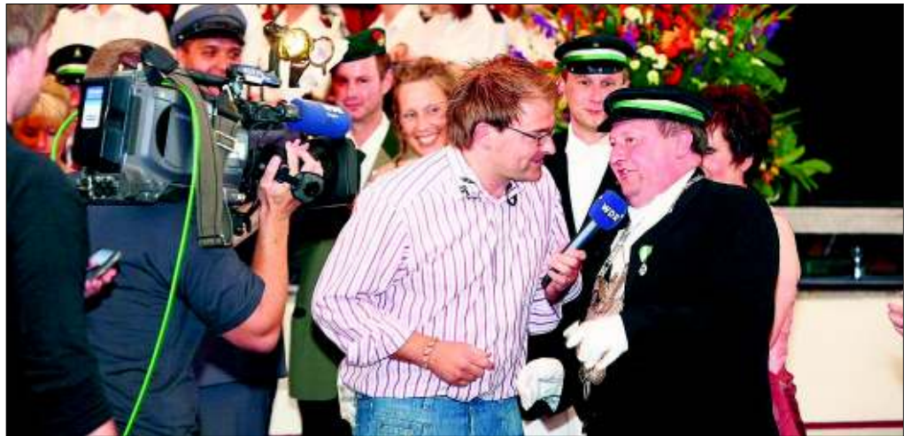
In Sachen medialer Präsenz geben wir den Ölpfern jederzeit gerne Entwicklungshilfe.